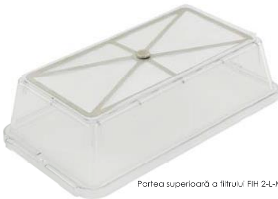
Partea superioară a filtrului FIH 2-L-MB

ușor înlocuit. Vă rugăm să consultați capitolul cu informații despre capacele interioare care urmează să fie utilizate.