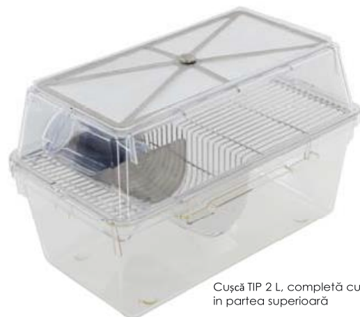
Cușcă TIP 2 L, completă cu filtru în partea superioară