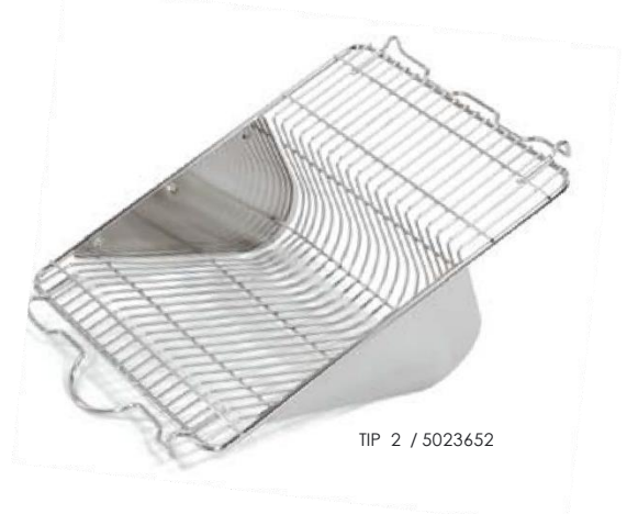
TIP 2 / 5023652