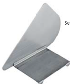
Separator TB 2-BS

Pentru a împărți suportul pentru hrana animalelor între alimente și sticla de apă.