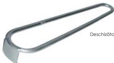
Deschizător de sticle Ö1

Deschizătorul nostru din oțel inoxidabil vă permite să scoateți cu ușurință capacul de pe sticla de apă.