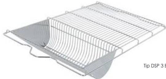
Tip DSP 3 BS, 5023613