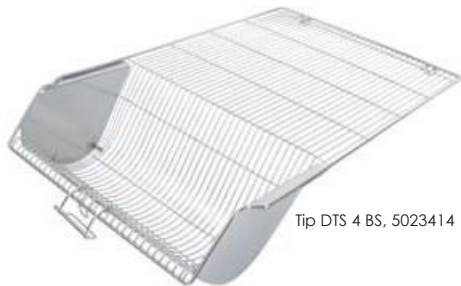
Tip DTS 4 BS, 5023414

În plus, suportul pentru hrană și apă poate fi prevăzut opțional cu un separator detașabil sau cu separator cu balamale integrate.