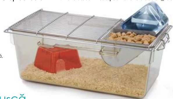
Cușcă tip 2L cu sticlă de apă, capac și accesorii

Informații suplimentare sunt disponibile în broșura intitulată „Tratamentul cuștilor în creșterea animalelor” de „AK KAB” Grup de lucru: www.tiz-bifo.de/download/publikationen/ab/ak_kab.html